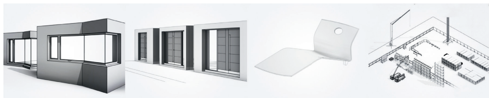
Revit 2019 umfasst jetzt über 5.000 neue Objekte

Zur Förderung einer noch besseren BIM-Arbeitsweise wurde eine gemeinsame Vorlagendatei für die Architektur und den Ingenieurbau entwickelt. Ab jetzt heißt es für alle Architekten, Tragwerksplaner und Gebäudetechniker in Deutschland, Österreich und der Schweiz: noch besser planen mit Revit.